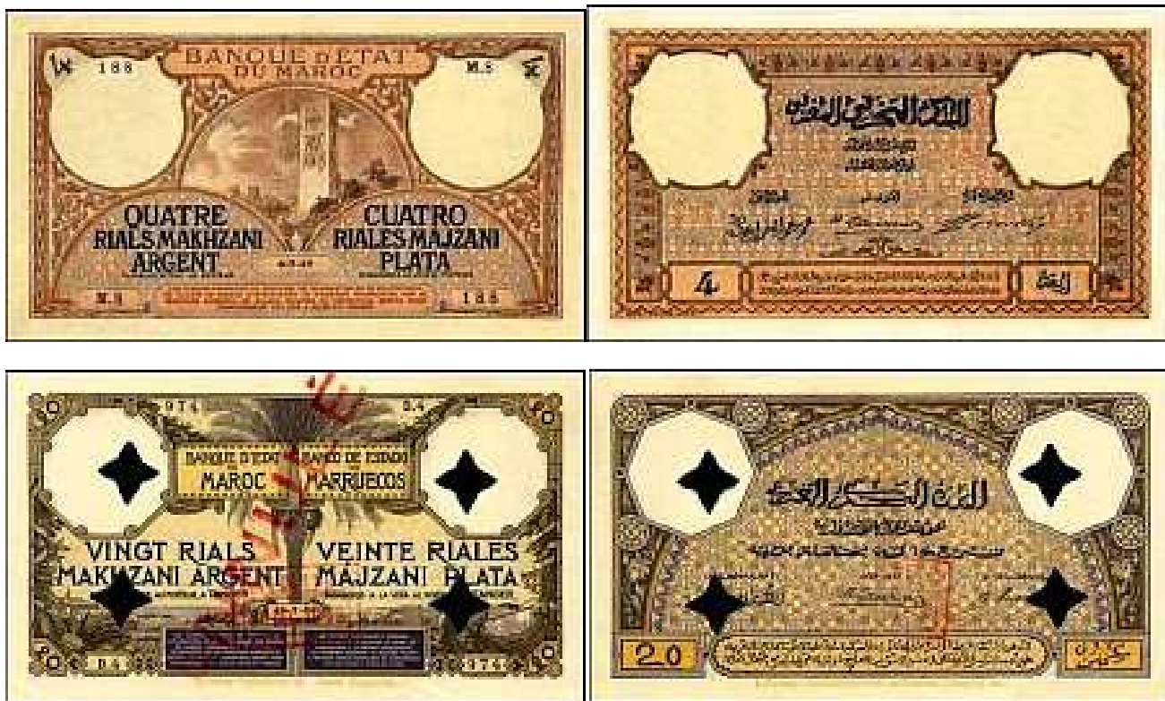
Rarissimes billets de 4 Rials et 20 Rials

Série 1920-1924 (pick 8 à 16) , des valeurs de 5F à 1000 F ont été émises, parmi lesquelles les plus grosses (500F & 1000F) ont circulé jusque dans les années 1950. On trouve la plupart de ces billets dans des états corrects, à l'exception du 100F pick 14, relativement rare, surtout en bel état de conservation. Le marché offre beaucoup d'exemplaires en belle qualité, notamment les petits 5F des années 1920-30, ainsi que le fameux billet de 500 Francs 1948, illustré ci-dessus, dont la provenance en quantité serait le fruit d'un braquage !