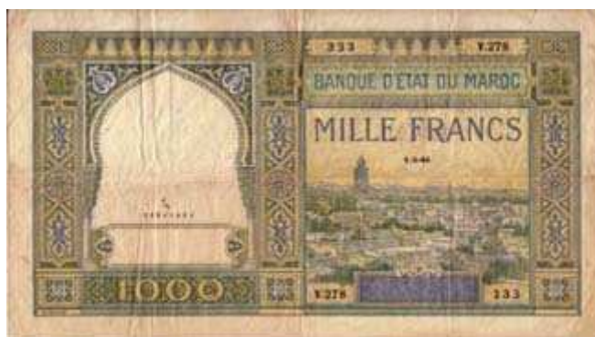
1000 Francs 1921-50 p16

Série 1928-1929 (pick 17 à 23a) , Certains billets de cette gamme sont similaires à la précédente, notamment les billets de 10F / 20F / 50F (p19). A part le superbe billet de 5000F, un des plus beaux billets du Maroc, cette série se trouve à peu près dans des états proches du SUP/NEUF. A noter que le billet de 5F (p23A), daté de 1922, n'a été mis en circulation qu'en 1941.