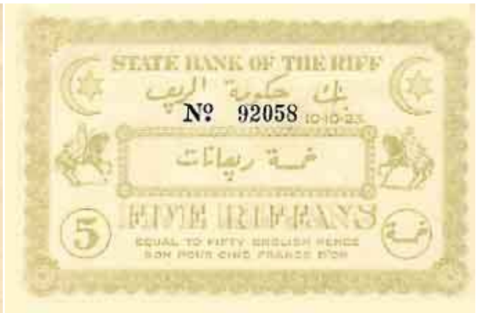
One Riffan & 5 Riffan, soulèvement d'Abd el Krim, dans le Rif, au nord du Maroc

Billets non émis, Une série de billets a été étudiée par l'imprimeur Thomas de la Rue, dans les années 1950, avec des valeurs de 100F (p45A), 500F (p46A), 1000F (p47A et 5000F (p48A). Ces billets sans réel style et d'un petit format n'ont jamais vu le jour autrement qu'en tant qu'épreuves d'impression ; On en trouve parfois dans certaines ventes aux enchères américaines.