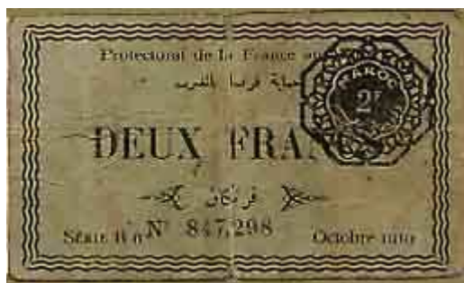
2 Francs 1919 p7

Tirages locaux et émissions de nécessité du protectorat de la France au Maroc, quatre petites valeurs imprimées sur du carton existant, 25 Centn / 50 Cent / 1F et 2F, elles ont été émises en 1919.