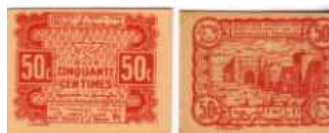
50 Centimes 1944 p41

2de guerre mondiale / Empire Chérifien, protectorat de la République française, Il existe trois petits billets en carton, (50 Cent / 1F / 2F), qui ont été émis pendant la guerre, pour faire face à un manque de numéraire. Ces billets sont courants, leur prix est plus élevé que la côte du Catalogue Pick.