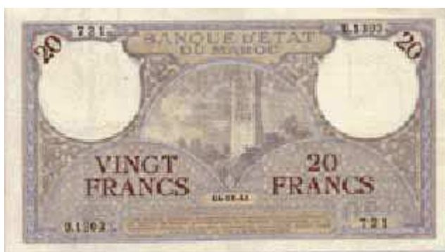
20 Francs 1929-45 p18

Série 1920-1924 (pick 8 à 16) , des valeurs de 5F à 1000 F ont été émises, parmi lesquelles les plus grosses (500F & 1000F) ont circulé jusque dans les années 1950. On trouve la plupart de ces billets dans des états corrects, à l'exception du 100F pick 14, relativement rare, surtout en bel état de conservation. Le marché offre beaucoup d'exemplaires en belle qualité, notamment les petits 5F des années 1920-30, ainsi que le fameux billet de 500 Francs 1948, illustré ci-dessus, dont la provenance en quantité serait le fruit d'un braquage !