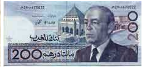
200 Dirhams Hassan II

Mais, à partir de 1930, la France, toujours soucieuse d'étendre son empire colonial, souhaite aller plus loin avec le Maroc, et commence alors la substitution de son administration directe au régime du protectorat. De même qu'en Algérie, la contestations monte, et l'idéologie nationaliste gagne du terrain, surtout dans les milieux étudiants.