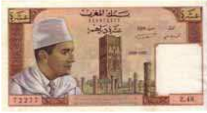
10 Dirhams Mohamed V, début des années 1960