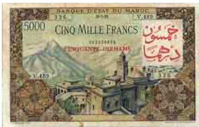
50 Dirhams sur 5000 Francs, juste après l'indépendance le Maroc a surchargé des billets de 5000 Francs et 10000 Francs.

Série 1948-1955 (pick 44 à 52), Après la 2de guerre mondiale, inflation oblige, les petites valeurs ont définitivement disparu, remplacées par des pièces. Cette série de 50F / 100F / 500F / 1000F / 5000F et 10000F (hormis les spécimens dont nous parlons plus loin) est la dernière avant l'indépendance. Les billets de 50F et 100F sont similaires aux billets des années 20, la taille étant réduite. Ces billets sont tous courants, quoique les grosses valeurs de 5000F et 10000F se rencontrent surtout surchargés 50 Da et 100 Da juste à l'indépendance.