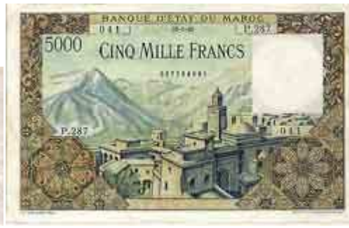
5000 Francs p49 (1953-58)